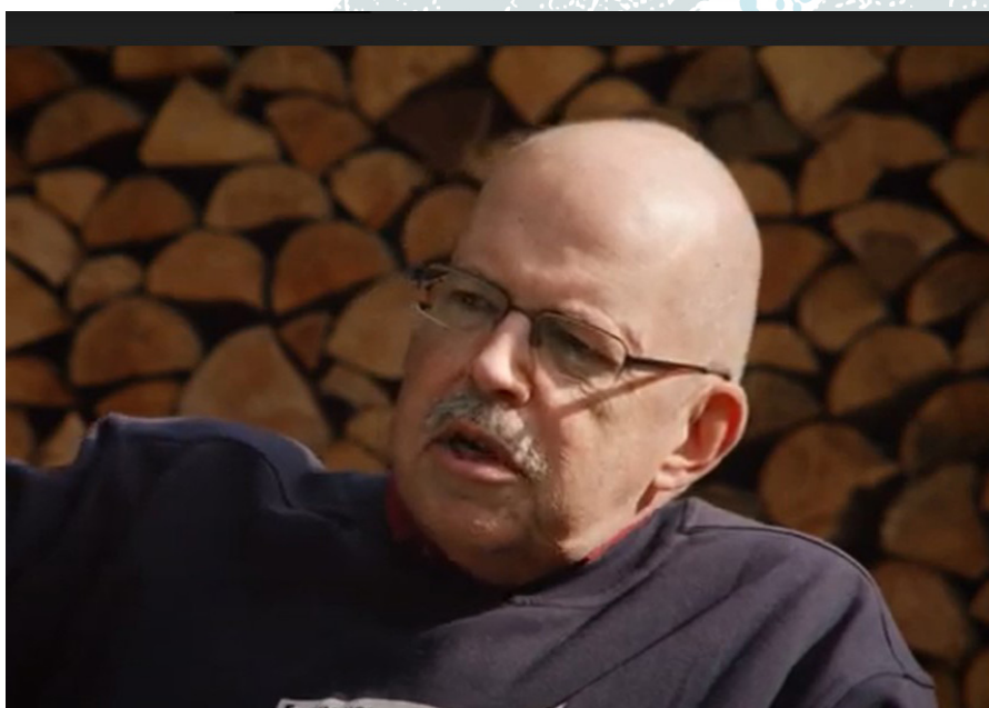
Kadrs no filmas "Valiant".